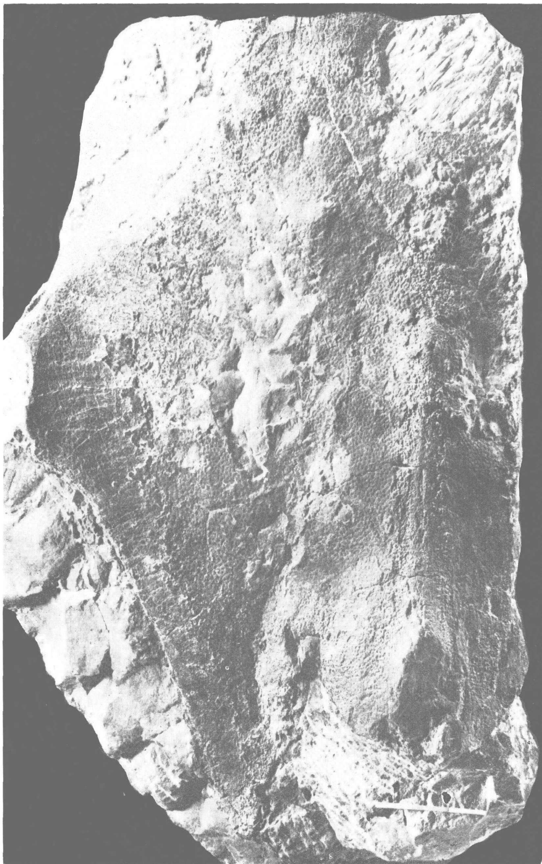
角箭甲鱼 ( Antiquisagittaspis cornuta g. sp. n.) 新属、新种。背甲, GV0001