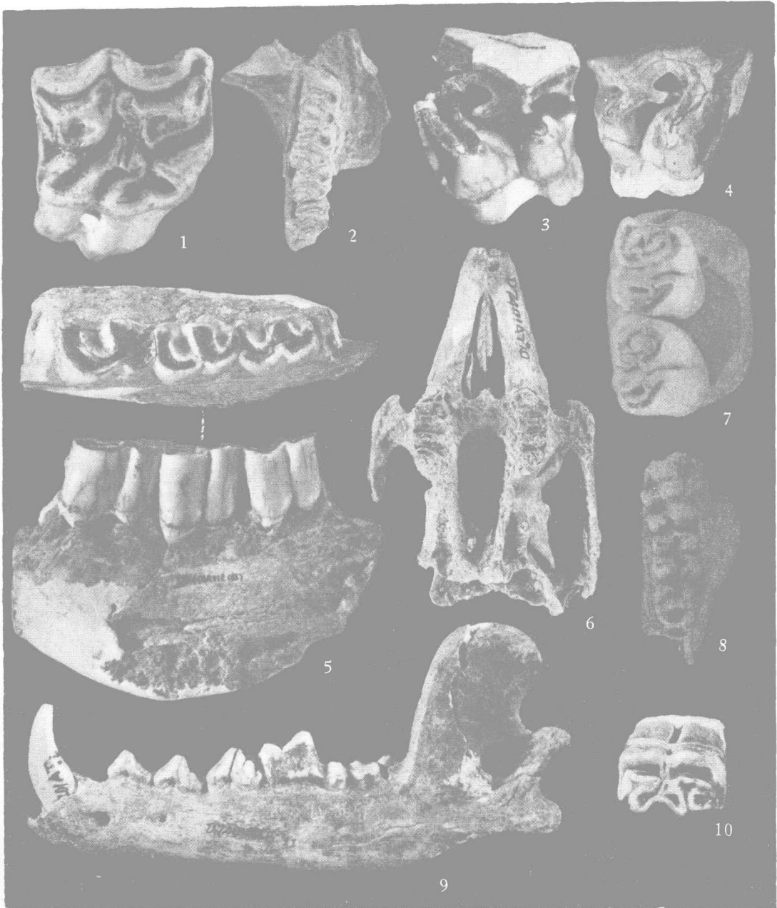
1.三门马 ( Equus sanmeniensis ) 右 M 1 顶面观, ×1; 2.河狸 ( Trogontherium sp.) 上牙床顶面观, ×1; 3—4.梅氏犀 ( Dicerorhinus merki ) 左、右 M 1 , ×1/2; 5.梅氏犀 ( Dicerorhinus merki ) 右下颌 (P 4 -M 2 ) 顶侧面观, ×2/5; 6.翁氏野兔 ( Lepus wongi ) 头骨底面观, ×1; 7.拉氏豪猪 ( Hystrix lagrelii ) 右下臼齿顶面观, ×4; 8.硕猕猴 ( Macacus robustus ) 右下颌骨顶面观, ×1; 9.变种狼 ( Canis lupus var. variabilis ) 左下颌侧面观, ×2/3; 10.三门马 ( Equus sanmeniensis ) 右下 M 1 顶面观, ×1/2。