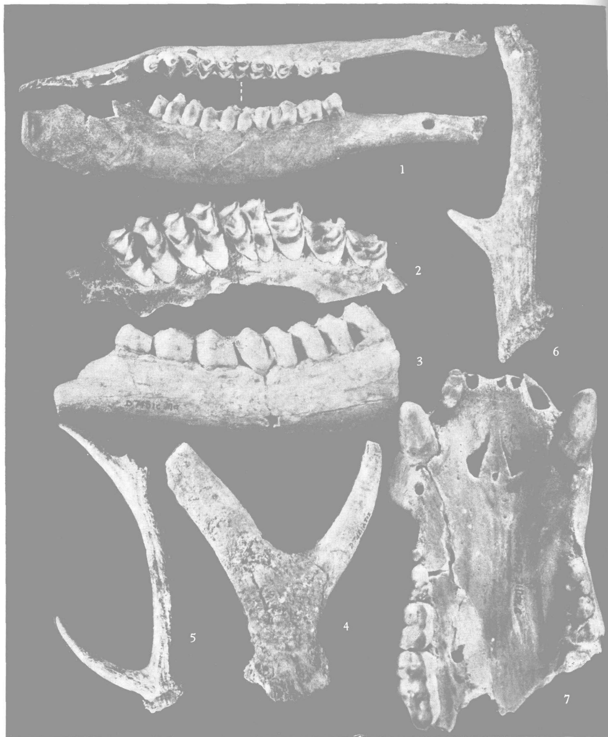
1. 赤鹿 ( Cervus canadensis ) 右下颌骨侧、顶面观, \times 1/2 ; 2. 肿骨鹿 ( Megaloceros pachyosteus ) 右上颌骨, \times 1/2 ; 3. 肿骨鹿 ( Megaloceros pachyosteus ) 左下颌骨侧面观, \times 1/2 ; 4. 葛氏斑鹿 ( Pseudaxis grayi ) 左角(残), \times 1/2 ; 5. 葛氏斑鹿 ( Pseudaxis grayi ) 右角侧面观, \times 1/5 ; 6. 麝 ( Moschus moschiferus ) 右角侧面观, \times 1/2 ; 7. 棕熊 ( Ursus arctos ) 头骨(残)底面观, \times 3/4 。