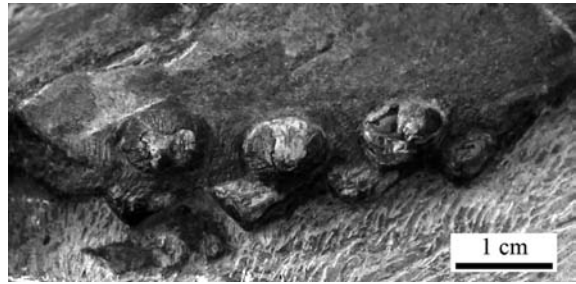
图2 双列齿凹棘龙(ZMNH M8804)上颌骨牙齿(左为前) Fig. 2 Maxillary teeth of Concavispina biseridens (ZMNH M8804), anterior to the left