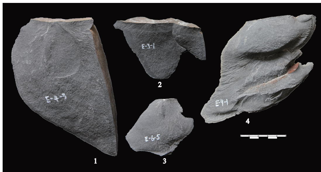
图 3 实验中硬锤剥片所获石片举例

后续分析之中，两类对比分析具有重要的意义。一是实验产品之间的对比，二是实验产品与遗址中出土物的对比。此次针对丁村遗址角页岩开展的打制实验的分析中，首先对实验中软锤与硬锤锤击石片进行了对比，观察、记录两类锤击法在实验中产品技术特征上的差异，其次是对实验产生的硬锤 / 软锤石片与通过观察挑选出的遗址中的疑似软锤石片进行对比。通过以上的对比分析，来判断软锤锤击是否在丁村石器加工中被使用。在工具修理实验中，对同类工具采用不同方法修理所产生的修理痕迹进行记录 and 对比，并分别与考古标本进行对比，帮助认识该遗址中使用的具体修理技术。限于篇幅，具体的实验数据分析另文介绍，本文只对结果略做总结介绍。