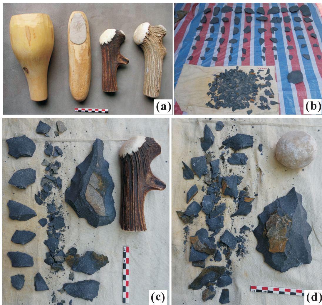
图 2 实验中采用的工具及部分实验举例

剥片实验,首先分别进行硬锤剥片和软锤剥片,选取相同原料,用两类锤击法各生产石片 25 个。在软锤打片实验中为了应对角页岩硬度较大的特点,准备了重达 2kg 的硬木锤(图 2-a),但仍无法生产完整石片,最终软锤打制实验采用鹿角完成。在分别