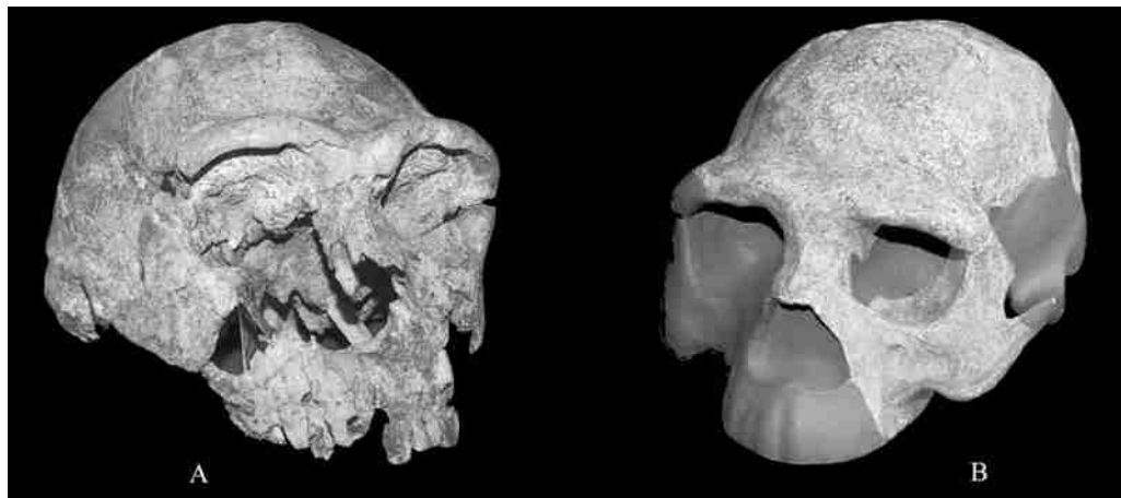
图 2 KNM-ER 3733 号头骨(A)与南京 1 号头骨(B)前侧面观 Fronto-lateral view of the crania of KNM-ER 3733 (A) and Nanjing 1 (B)

Linear measurements recorded in mm. Data from[7], Data from[13], ▼ Data from[21].