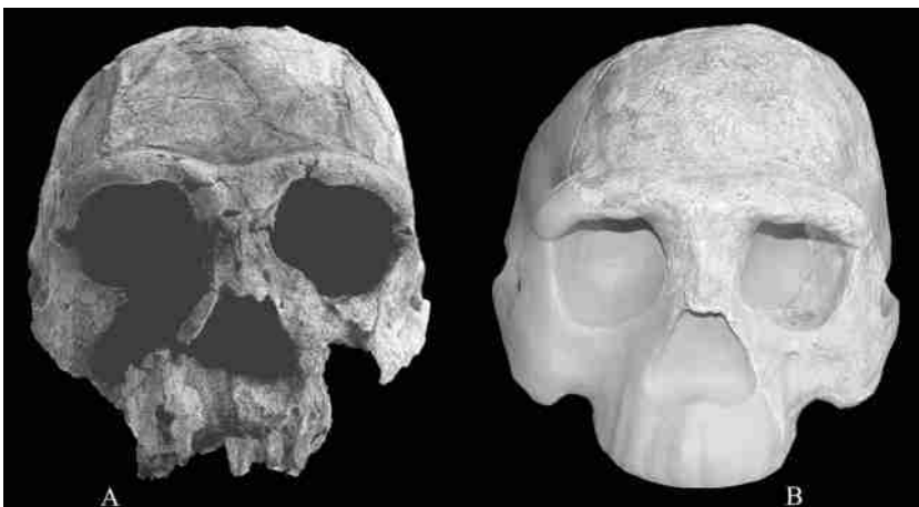
图 1 KNM-ER 3733号头骨(A)与南京 I号头骨(B)前面观 Front view of the crania of KNM-ER 3733 (A) and Nanjing 1 (B)

本项研究是对南京 1 号头骨与 KNM-ER 3733 头骨作形态学上的比较,梳理出二者之间形态上的疏近情况。此项比较的目的有二:一是检验 KNM-ER 3733 头骨标本分类上的位置;二是检验从 KNM-ER 3733 头骨到南京 1 号头骨将近 1 百万年时间间隔内头骨形态是否保持稳定,如果 KNM-ER 3733 头骨是属于直立人的话(图 1)。