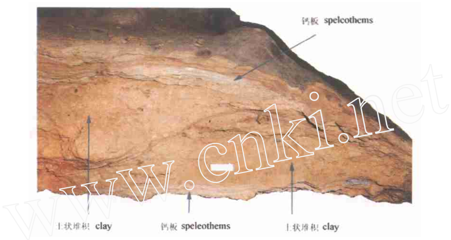
图 2 田园洞地层剖面顶部钙板与土状堆积交互层

The upper most part of the profile in Tianyuan Cave , showing the interbeds of speleothems and clay deposits.