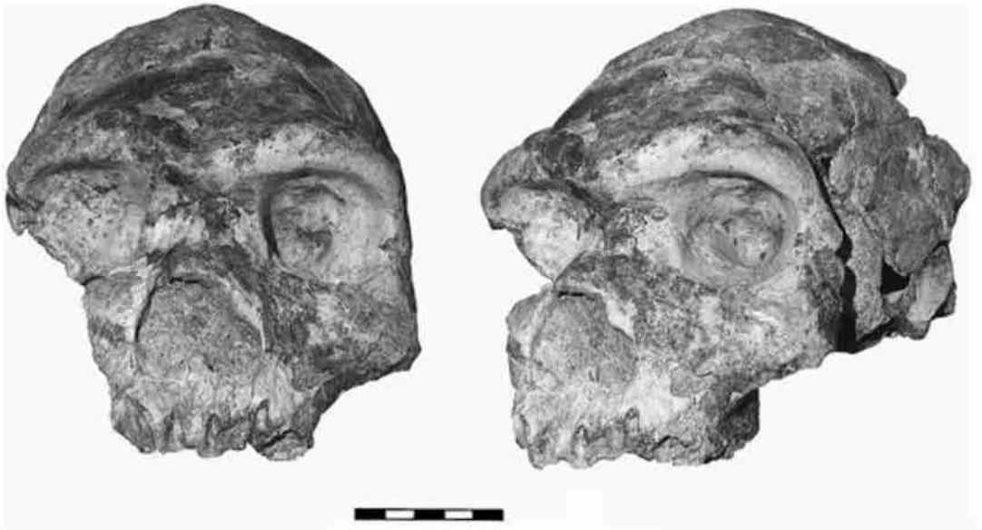
图 1 Bodo 头骨化石(引自 Rightmire [9] ) Bodo cranium ( cited from Rightmire [9] )

间均较亚洲为早。根据化石发现及确切的年代测定数据, 非洲直立人出现及活跃的时期在距今 170—100 万年 [3-4] 。近 10 年来, 古老型智人在非洲及欧亚出现时间以及更新世中期非洲和欧亚地区古人类相互之间的演化关系引起了国际古人类学界日益增多的关注 [5-6] 。