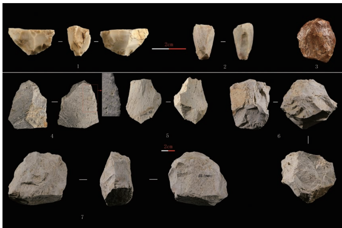
图 3 黄泥梁遗址发现的石制品

12HNL-43 (图 3-5), 更新台面石片, 岩性为闪长玢岩。长宽厚为 65mm、50mm、23mm, 重 66g; 硬锤打击法, 台面为素台面, 台面宽厚为 29mm、17mm; 石片角为 115°, 台面背缘角为 71°; 背面有一条纵脊, 脊左侧有向石片腹面方向的连续片疤, 推测其为更新台面的石片。