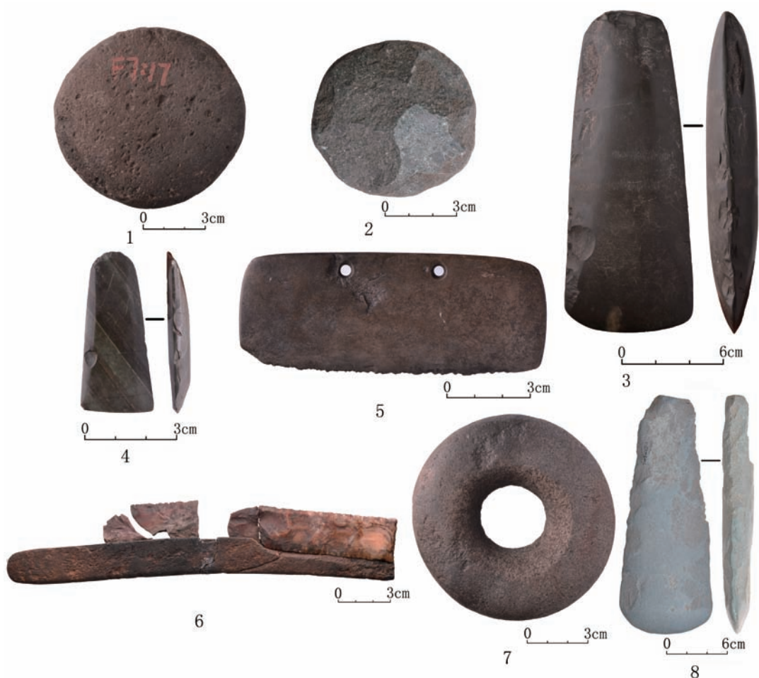
图 3 哈民忙哈遗址出土石器

石磨盘、磨棒的磨制食物的功能是比较明显的。一般说来，石磨盘与磨棒的大小、厚度、重量跟加工对象的硬度、加工数量成正比，如北美西南部以加工玉米为主，其磨盘、磨棒