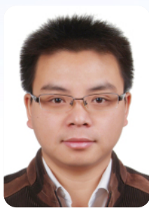
吴怀春 Huaichun WU

吴怀春，中国地质大学（北京）教授，博导，主要从事地层学与海洋地质学的教学与研究。现任海洋学院院长、中国地质学会沉积地质专业委员会副秘书长和“地时-中国”秘书长。曾获国家杰出青年科学基金和优秀青年科学基金资助，先后获国际沉积学会首届“Shun Shu Prize”、黄汲清青年地质科学技术奖、侯德封矿物岩石地球化学青年科学家奖等荣誉。主要研究成果包括：1. 建立了奥陶纪、石炭纪和二叠纪天文年代格架，实现了古生代旋回地层学及天文年代学的突破；2. 证明了地球轨道力深刻地影响着白垩纪温室条件下中国东北陆地环境的气候变化和沉积过程，建立了松辽盆地晚白垩世持续时间2800万年的天文年代标尺，完善了松辽盆地上白垩统高精度年代格架及其与海相地层的对比方案；3. 建立了南海中新世以来完整的地磁极性年代格架，对探讨南海沉积、环境与生命演化提供了重要的年龄约束。