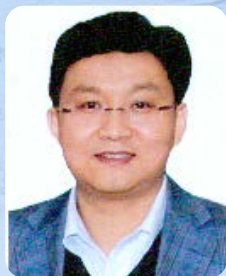
徐义刚 Yigang XU

中国科学院广州地球化学研究所研究员，中科院院士。1994年获法国巴黎第七大学博士学位。现任同位素地球化学国家重点实验室主任。国家杰出青年基金和创新群体获得者，主持科技部973项目、中科院专项B等重大项目，2018年当选美国地质学会会士。Terra Nova, Frontier Earth Science 副主编。主要从事地幔岩石学、地球化学和深部动力学研究。主要研究方向包括：1) 系统总结中国东部岩石圈减薄的地质学、岩石学和地球化学证据，限定了岩石圈减薄的时间和机制。2) 阐明峨眉山大火成岩省的地幔柱成因，为地幔柱影响下固体地球不同圈层的系统行为研究提供了范例。3) 厘定出东亚大陆新生代玄武岩的源区普遍存在西太平洋俯冲板片组分，构建了大地幔楔系统中形成板内玄武岩的新机制。曾获国家自然科学基金二等奖、李四光地质科学奖等。